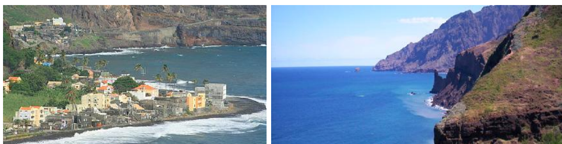
Ilustração 5 - Zonas costeiras de Paúl

Não obstante a configuração orográfica, pouco acessível, da orla costeira do Paúl, esta não deixa de ter a sua importância e de constituir-se como potencial de desenvolvimento para os transportes marítimos, pescas, actividades portuárias, actividades de lazer, praias, zonas balneares, espaço para desenvolvimento turístico e outras actividades afins.