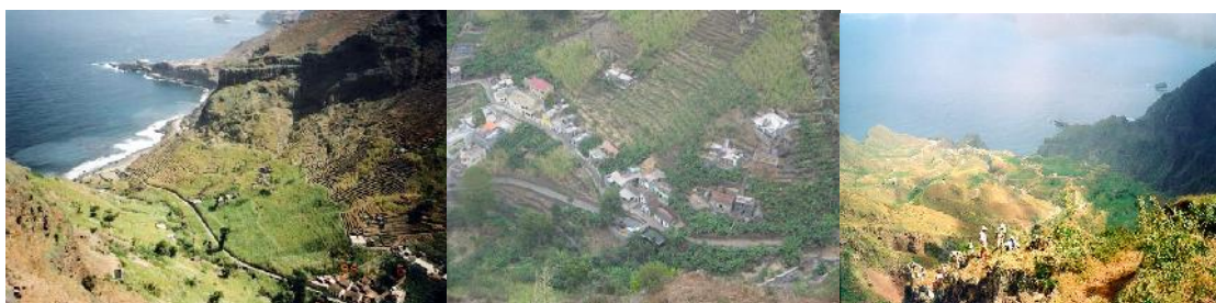
Ilustração 3 - Ribeiras de Janela e de Penedo

O carácter extremamente montanhoso, a diversidade biológica, e o sistema agro-ecológico, o sistema hidrográfico e a rede de caminhos vicinais, constituem aspectos dos recursos paisagísticos que poderão ser orientados para um turismo de natureza.