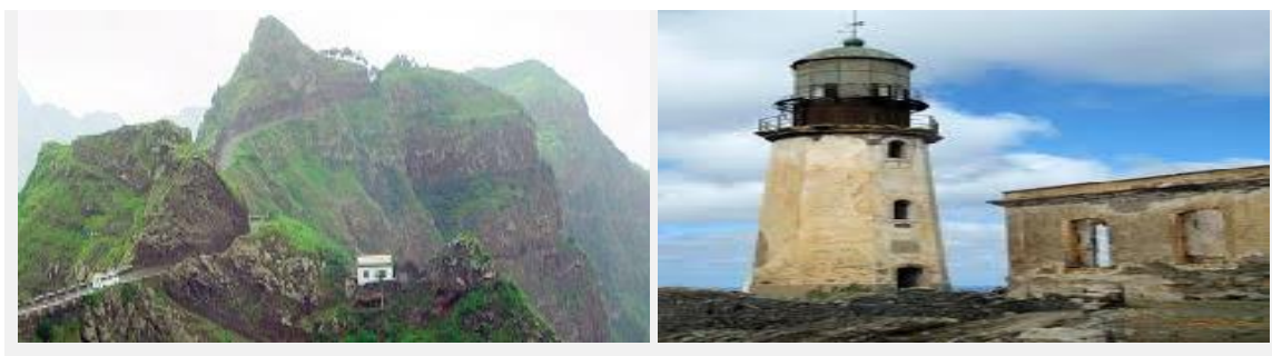
Ilustração 7 - Farol Pereira de Melo

É uma torre branca octogonal em alvenaria rebocada, com lanterna e galeria, e 16 metros de altura. Em anexo existe um edifício térreo para faroleiros, abandonado e em más condições