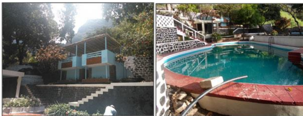
Ilustração 10 - Estância turística Passagem

Esta estância é muito visitada por pessoas oriundas de várias partes da ilha e da ilha vizinha S. Vicente, bem como por turistas nomeadamente franceses, alemães, ingleses, entre outros.