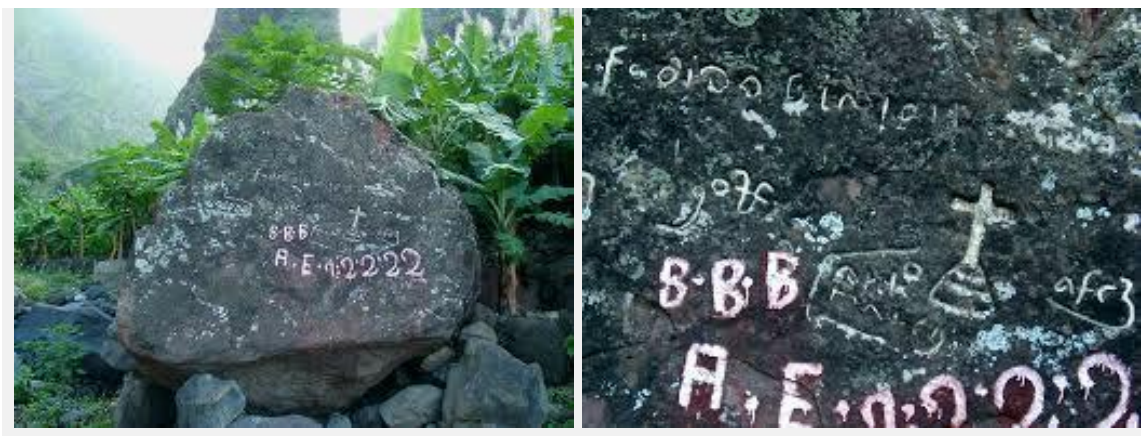
Ilustração 4 - Pedra Escrivida na Ribeira de Penedo