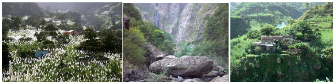
Ilustração 2 - Vale do Paul

É um vale luxuriante com uma predominância de verde rara no arquipélago e clima tipo temperado com temperaturas moderadas durante o ano constituindo uma potencialidade que funciona como atractivo de pessoas de outras paragens para fixação definitiva ou para efeitos de turismo.