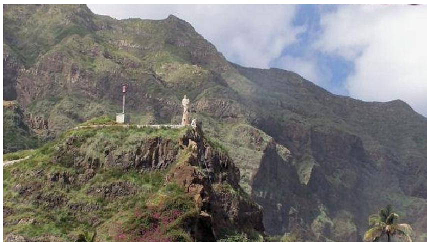
Ilustração 8 - Santo António das Pombas