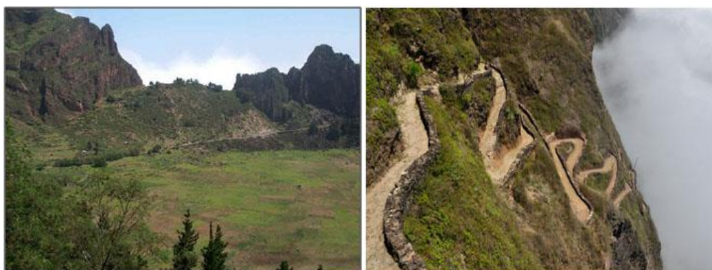
Ilustração 1 - Cova/Paúl e Descida de Cova para o Paúl

A riqueza biológica e diversidade paisagística concorrem para uma orientação do turismo nacional e internacional para o Paul o que pressupõe a infra-estruturação turística do município por forma a potenciar essa actividade e contribuir para o desenvolvimento do concelho.