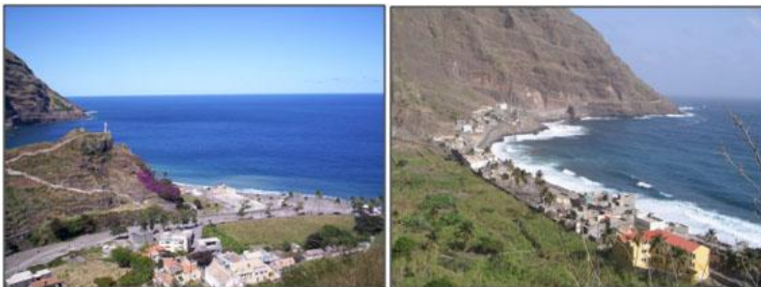
Ilustração 6 - Cidade das Pombas